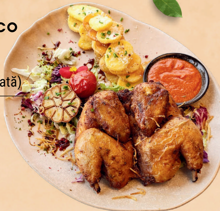
GALLETTO ALLA ROMESCO 950 GR 130 RON (cocoşel de munte, cartofi aromatizaţi, sos romesco, mix salată)