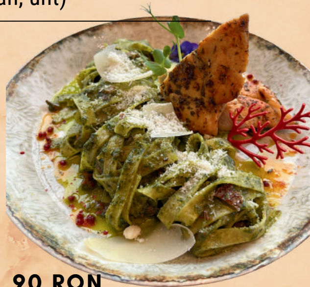
POLLO GENOVESE 500 GR 90 RON (piept de pui sous vide, tagliatelle, sos pesto, parmezan, roşii uscate, usturoi)