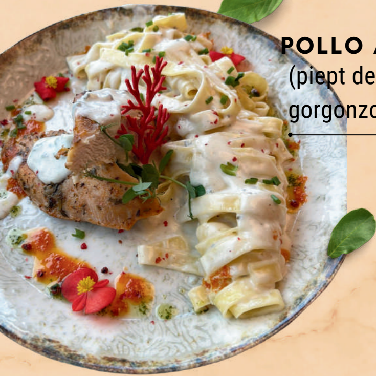
POLLO ALFREDO 500 GR 90 RON (piept de pui sous vide, tagliatelle, sos alb, gorgonzola, parmezan, unt)